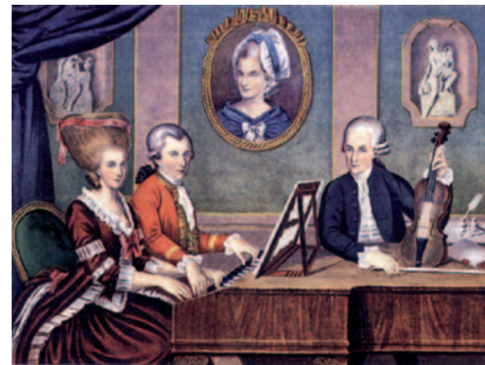
Mozart mit seiner Schwester Maria Anna am Klavier, daneben der Vater Leopold Mozart, 1780

verlassen hat. Denn die Besetzung ist zwar schlank gehalten, es gibt keine Pauken und Trompeten, statt der Oboen spielen die von Mozart so geschätzten Klarinetten, und die Tonart A-Dur ist sehr licht – doch diese Heiterkeit ist durchaus doppelbödig. Unüberhörbar ernst erklingt der Mittelsatz in der Paralleltonart fis-Moll, der wiegende Siciliano-Ductus mutet geradezu gespenstisch an. Darauf wirkt die unvermutete Heiterkeit des finalen Rondos ähnlich wie die Schusszenen der Opern, die Mozart mit Lorenzo da Ponte geschaffen hat, eben auch „Le nozze di Figaro“. Nach vielen Wirren und Enttäuschungen nimmt man sich bei der Hand und feiert zusammen, ganz gleich was zuvor geschehen ist. Wenngleich die Zeitgenossen für Mozarts reifere Klavierkonzerte weniger Verständnis aufbrachten, so wurden diese im 19. Jahrhundert ausgesprochen hoch geschätzt. Mozart freilich hatte davon nichts mehr, denn seinen „fetten Jahren“ folgten, wie wir wissen, sehr magere, in denen er an vermögende Freunde Bettelbriefe schreiben musste und vergeblich eine einträgliche Anstellung bei Hofe anstrebte.