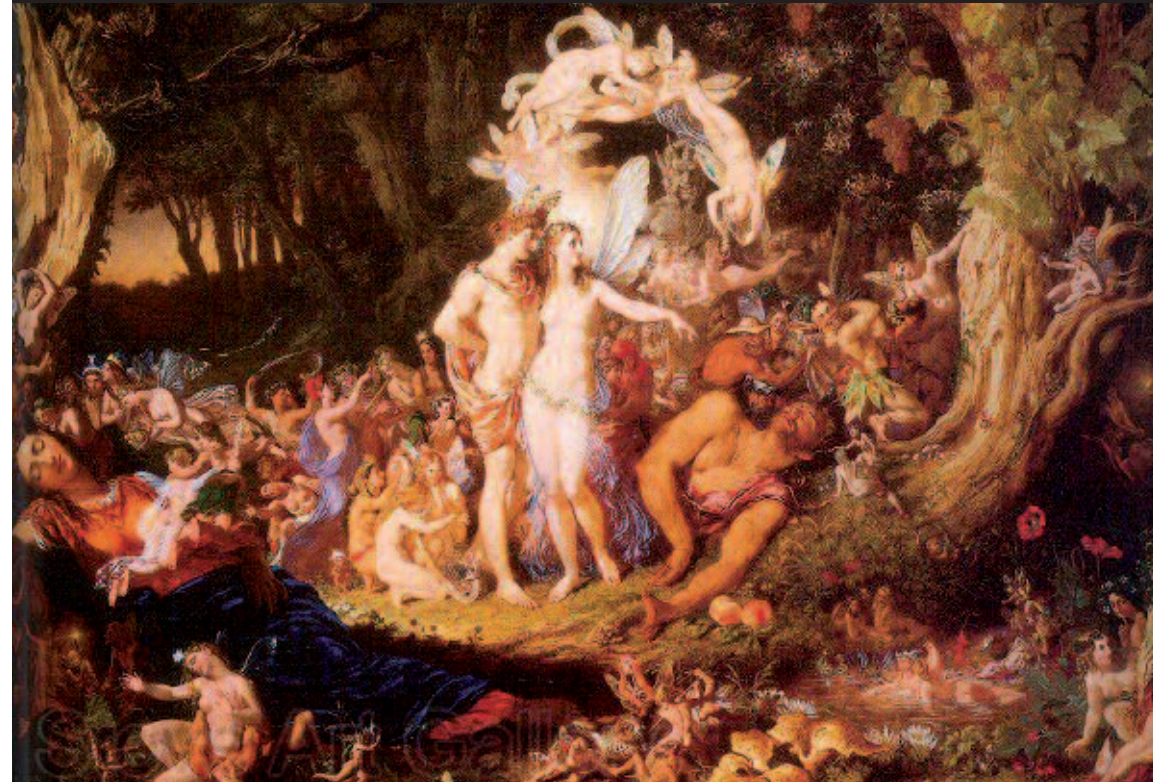
Die Versöhnung zwischen Oberon und Titania von Sir Joseph Noel Paton, 1847