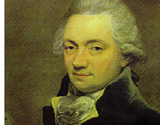
Johann Peter Salomon Portrait von Thomas Hardy, 1792