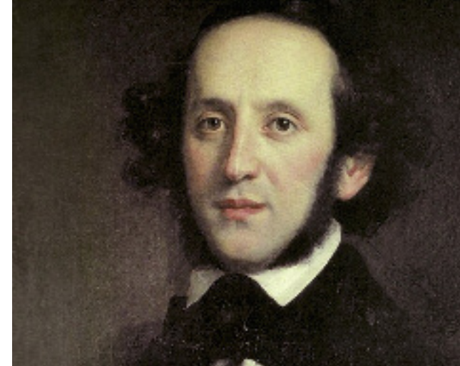
Felix Mendelssohn Bartholdy Portrait von Edward Magnus, 1846