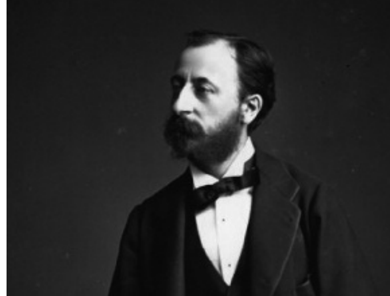
Camille Saint-Saëns ca. 1880

„Niemand kennt die Musik der ganzen Welt besser als Monsieur Saint-Saëns“, urteilte Claude Debussy über seinen älteren Kollegen. Denn in seinem langen Leben war er nicht nur als Musiker und Komponist sehr vielseitig, er betreute auch die ersten Gesamtausgaben der Werke von Rameau und Gluck, war dazu Dichter und Dramatiker, Astronom, Naturwissenschaftler, Philosoph, Archäologe und Ethnologe, Zeichner und Karikaturist. Als Journalist beobachtete er das musikalische Geschehen seiner Zeit, als Gründer der Société Nationale de Musique setzte er sich für die Eigenständigkeit der französischen Musik ein und ermöglichte den jungen Komponisten Aufführungen ihrer Werke. Nicht zuletzt wirkte er als Pianist, Dirigent und über Jahrzehnte als Organist an der Pariser Eglise de la Madeleine. Die Eckdaten seiner Biographie – geboren 1835 acht Jahre nach Beethovens Tod, gestorben 1921 drei Jahre nach Debussy und acht Jahre nach der skandalumwitterten Uraufführung von Strawinskys „Sacre du printemps“ – mögen beleuchten, welche riesige Entwicklung Saint-Saëns in seinem Leben und Werk begleitet hat. Dass seine eigene musikalische Tonsprache über ein dreiviertel Jahrhundert sich dabei allerdings kaum verändert hat und frei von allen inneren Regungen wirkt, wurde ihm später vorgeworfen. So meinte Ferruccio Busoni: „Er schien das Komponieren als eine angenehme Geistesübung zu pflegen. Man könnte aus seiner Musik auch nicht entnehmen, ob er gütig, liebes- oder leidensfähig war.“