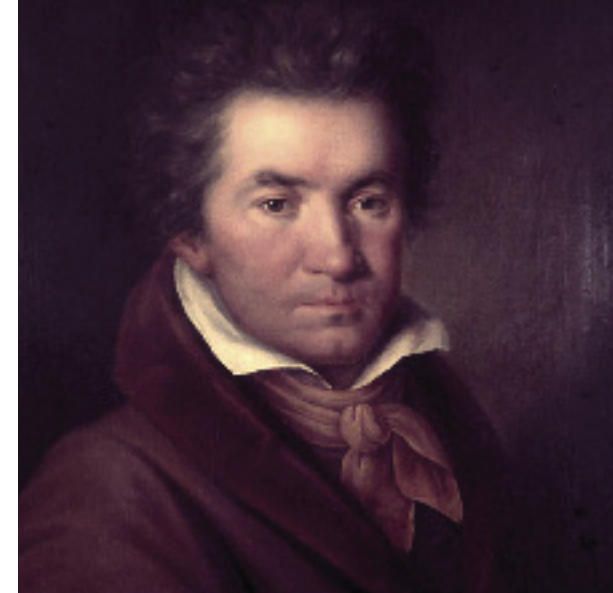
Ludwig van Beethoven Portrait von Willibrod Mähler, 1815